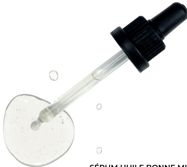
SÉRUM HUILE BONNE MINE