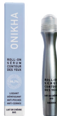
SÉRUM CONTOUR DES YEUX AU LAIT DE CHÈVRE BIO