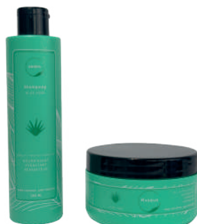
KÉRATINE & ALOE VERA