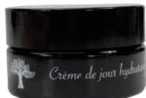
CRÈME DE JOUR