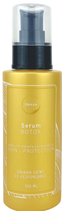
SÉRUM BOTOX CAPILLAIRE

SOINS EXPERTS POUR TOUS LES TYPES DE CHEVEUX