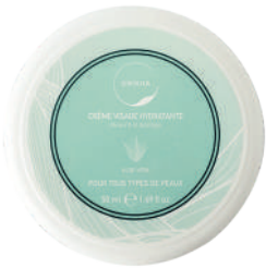
CRÈME VISAGE HYDRATANTE À L'ALOE VERA