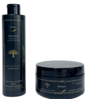
KÉRATINE & HUILE D'ARGAN

Le Botox capillaire, riche en peptides, vitamines et huiles végétales, hydrate intensément et renforce la fibre capillaire, réparant les longueurs abîmées. Idéal pour revitaliser et hydrater vos cheveux en profondeur.