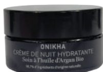
CRÈME DE NUIT