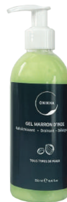
GEL MARRON D'INDE