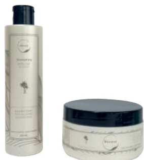
KÉRATINE & COCO